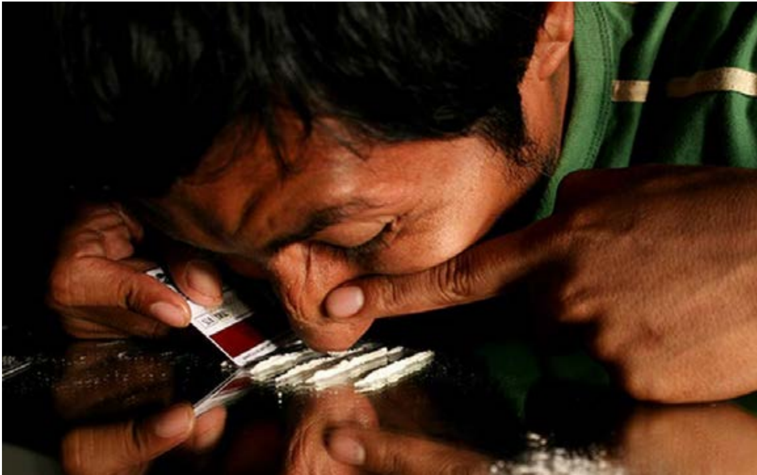
Consumo de cocaína creció 60% en 3 años

pureza, lo que se queda en las calles de Ciudad Bolívar o Bosa es a menudo un producto «estirado» o rendido con cal, polvo de ladrillo o harina.