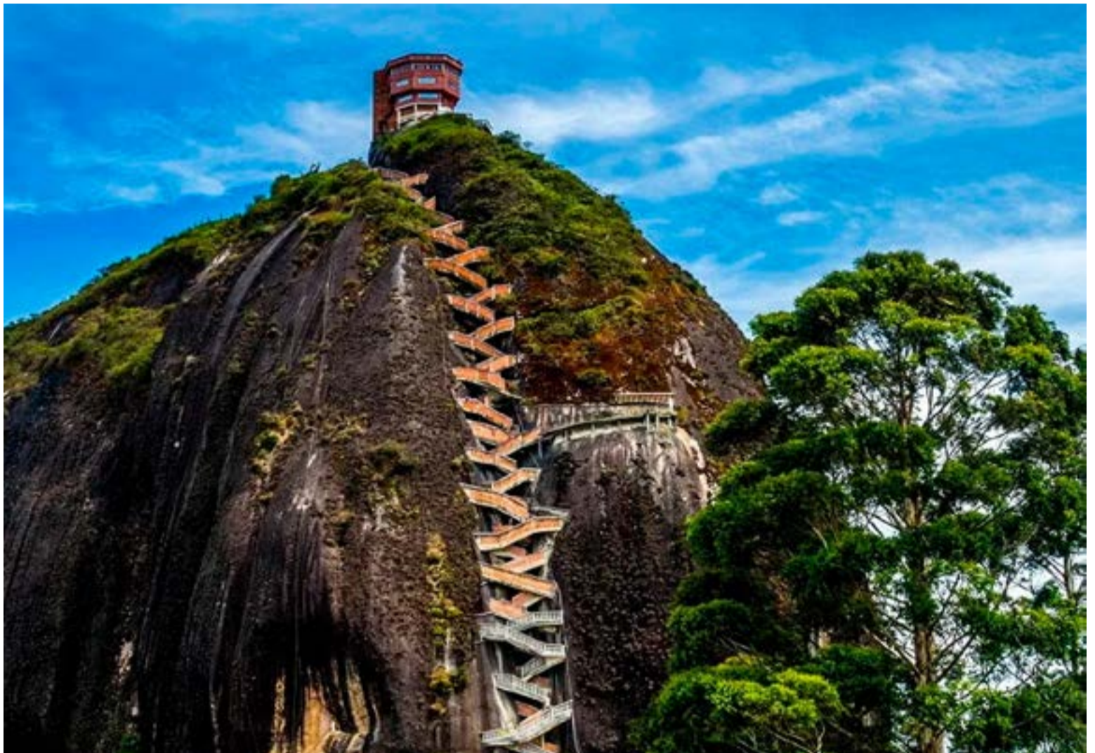
El Peñón de Guatapé a un monolito de 220 metros de altura localizado en el municipio que lleva su nombre .

La Piedra, compuesta por cuarzo, feldespato y mica, fue escalada por primera vez en 16 de