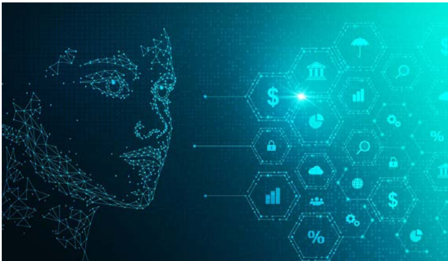
Algoritmos informáticos son más utilizados en marketing digital

Allí nos contagiamos, permitimos que nos rija el pánico y terminamos bajo la dictadura de los dueños del algoritmo.