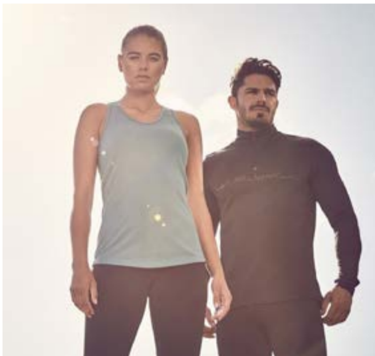
El cuerpo humano, es el vehículo físico que nos permite vivir e interactuar en este bello Planeta.

Los fines de semana se puso de moda el slogan «hoy es viernes y el cuerpo lo sabe». Mientras se detiene al actividad laboral, en lo que se supone es un receso para el descanso, se convoca a