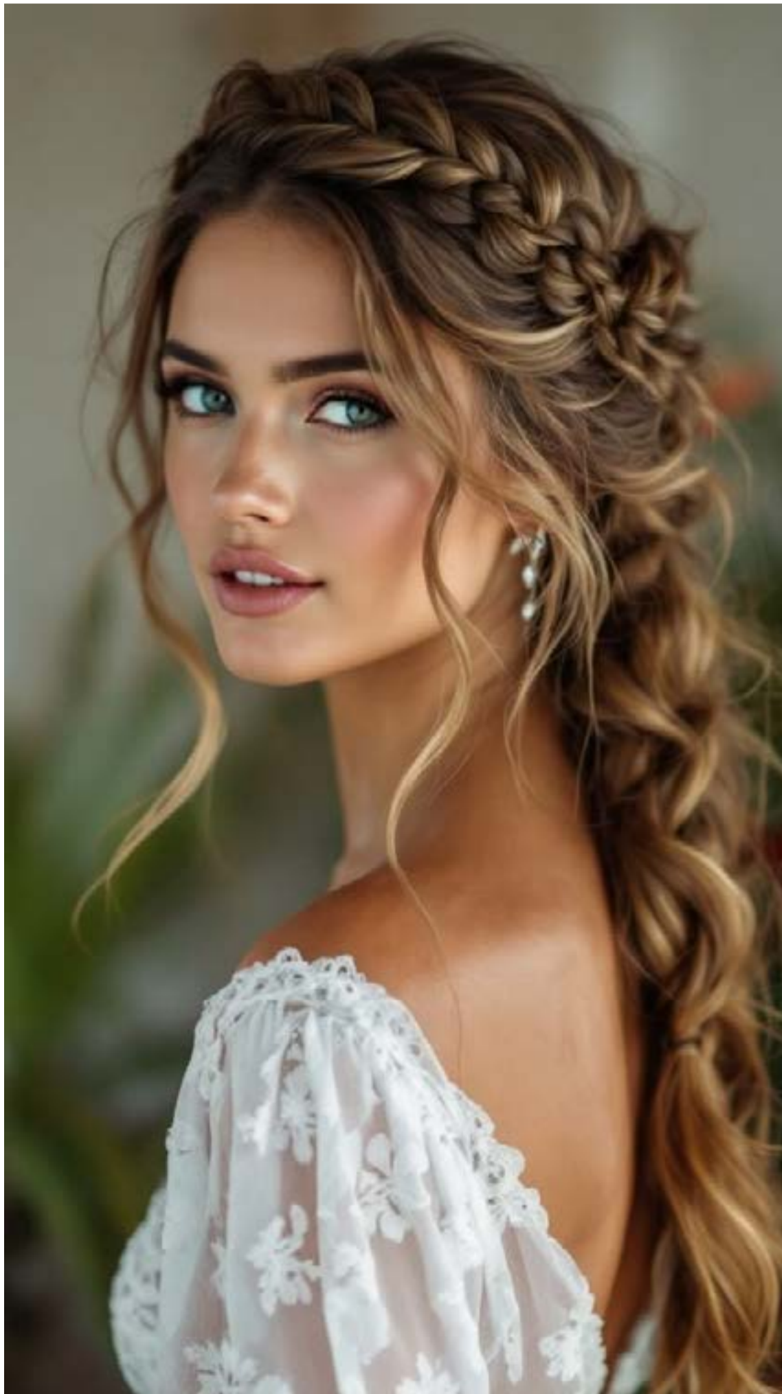
Belleza y Estilo

Expertos sugieren que este encuentro es un