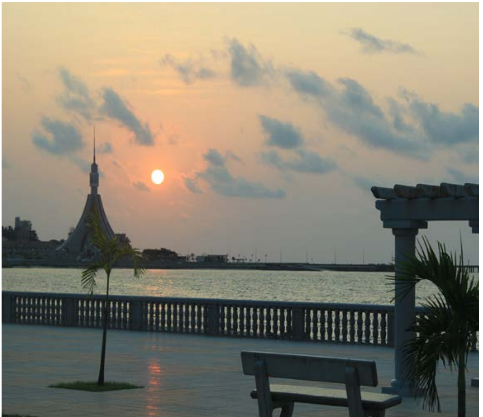
La Torre de la Libertad, en Bata, Guinea Ecuatorial, es un imponente monumento erigido para conmemorar la independencia del país. Su diseño y altura simbolizan la aspiración de la nación a la autonomía y el progreso.

La torre, cuya silueta se recorta contra el horizonte del Golfo de Guinea, se ha convertido en el punto de referencia ineludible para locales y visitantes. Su diseño, que combina líneas futuristas con una iluminación que transforma el paisaje nocturno de la ciudad, representa la transición de Guinea Ecuatorial hacia una era de desarrollo urbano impulsada por la bonanza de sus recursos naturales. Desde su plataforma de observación, se domina una vista privilegiada del puerto y de la expansión de una ciudad que busca posicionarse como un eje logístico y turístico en la región. Para los habitantes de Bata, la torre es mucho más que un mirador; es el orgullo de una «nueva era» que busca dejar