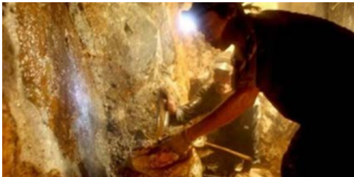
Las zonas más ricas y disputadas por el oro en Antioquia son el Bajo Cauca (municipios como Cáceres, Caucasia, El Bagre, y Tarazá) y el Nordeste Antioqueño (Remedios y Segovía), donde la minería, legal e ilegal, es la principal actividad económica.

Las ganancias multimillonarias obtenidas del oro ilícito son reinvertidas en la expansión de las estructuras armadas, la compra de armamento de guerra —in-