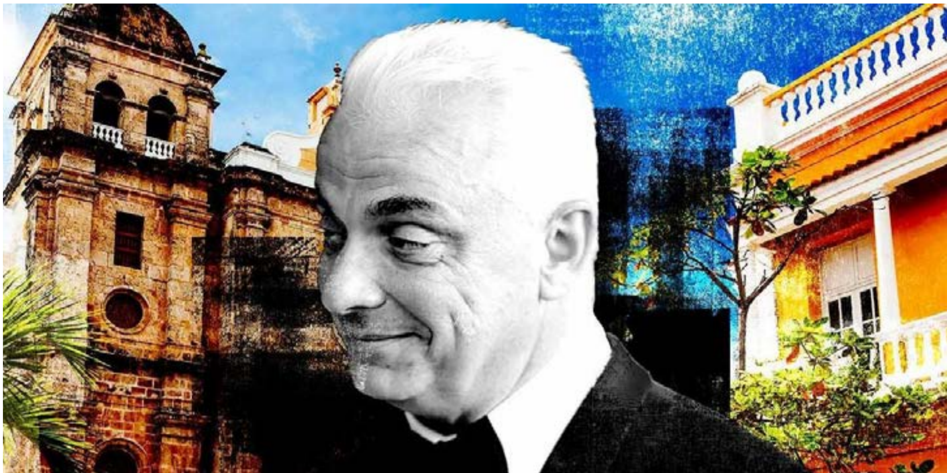
El príncipe belga Henri de Croÿ, cuya fortuna y propiedades en el Caribe colombiano están hoy bajo el cerco de la justicia.