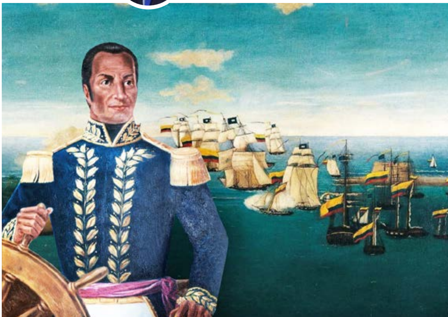
Almirante, José Prudencio Padilla

El periodista y psicólogo Henry Sánchez Olarte, reconocido por su extensa obra dedicada a rescatar figuras emblemáticas de la historia nacional, presenta en José Prudencio Padilla, el héroe del Lago Maracaibo (2025) un relato vibrante y profundamente humano sobre uno de los héroes más injustamente tratados de la independencia: el almirante José Prudencio Padilla López, símbolo de la gesta naval libertadora y mártir de la ingratitud política.