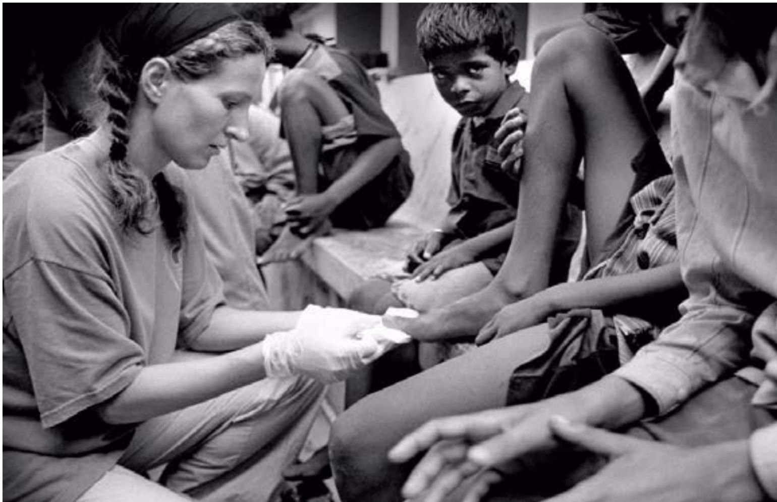
«Después del amor, la simpatía es la pasión divina del corazón humano», patentizó el escritor y orador irlandés Edmund Burke. Los filósofos de las escuelas antiguas y modernas califican la bondad como un don humano, tan necesario para la sociedad, como para conseguir la convivencia y la paz.

«También es la inversión que nunca falla», concibió el escritor norteamericano Henry David Thoreau, autor de la «Vida en los bosques». La bondad tiene innumerables facetas desde