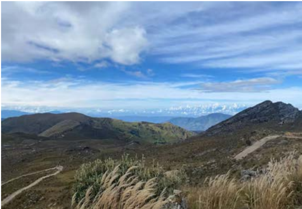
Páramo Almorzadero, Zona de Reserva Temporal de Recursos Naturales Renovables