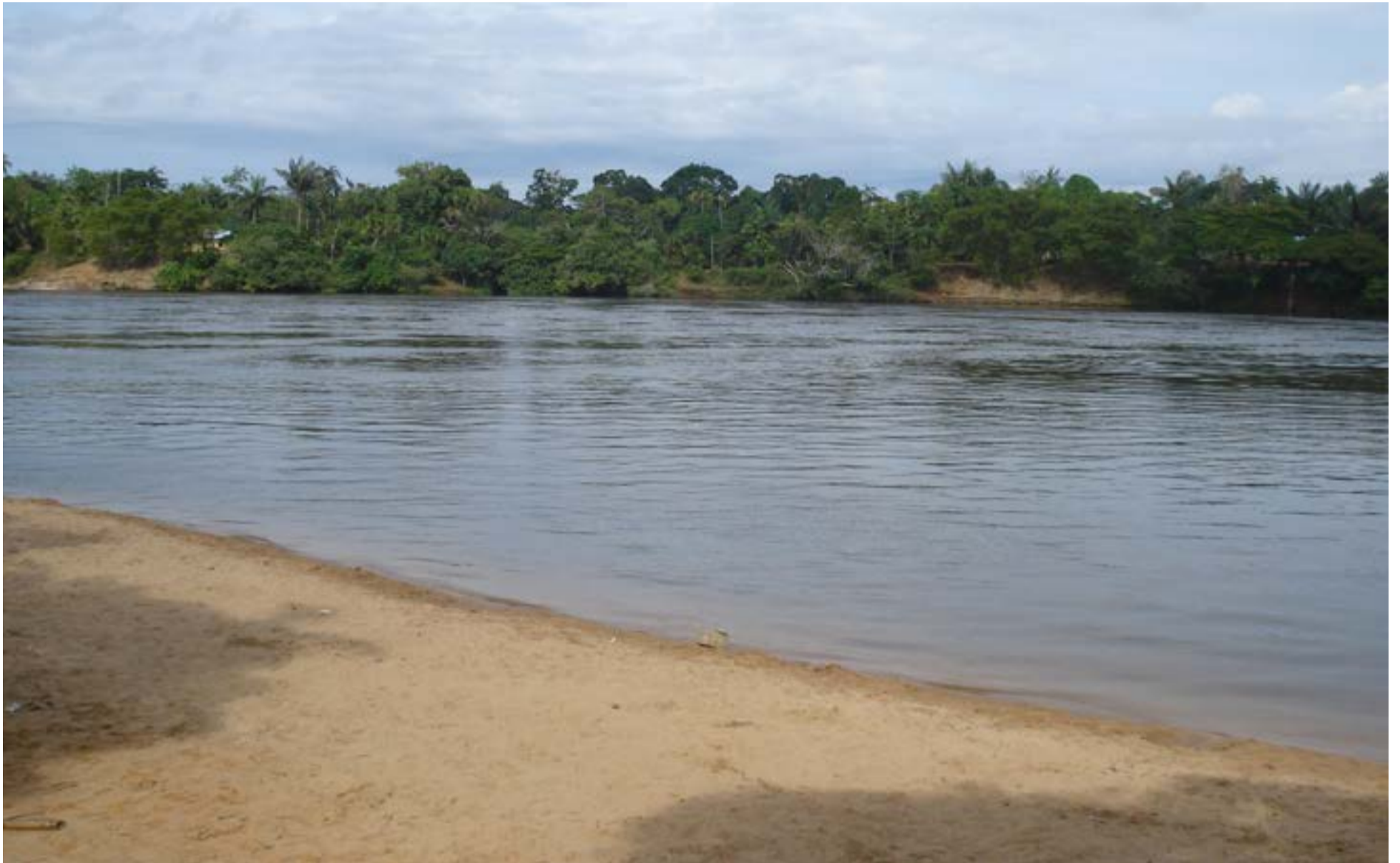
La serena amplitud del río Vaupés en Mitú, con sus aguas oscuras fluyendo tranquilamente junto a una orilla de arena clara, contrastando con la densa vegetación amazónica en el fondo.